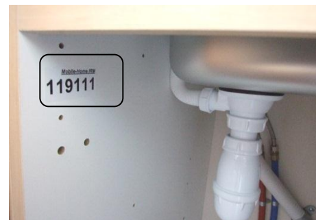
Mobil-home IRM 119 111 = Gamme 2009