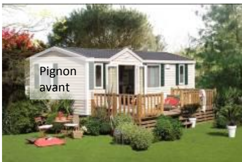
La façade du mobil-home face à vous, le pignon avant est situé sur la gauche.

Millésime châssis -03/2015 - Marketing IRM